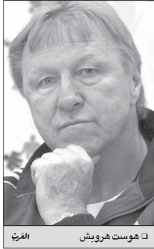
□ هوست هرويش العربي